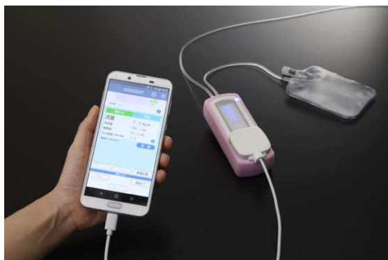
クーデックエイミーPCA

本品は大研医器（株）が開発した使い捨てできる 10mm×10mm×2mm の超小型マイクロポンプを使用し、ポンプ全体の軽量化を実現させた点と、スマートフォンでの操作を可能にした点が大きな特徴です。また、マイクロポンプの大量生産技術開発も成功し、従来の PCA ポンプに比べて費用が抑えられ、医療費削減の効果も期待されています。