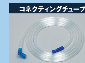
コネクティングチューブ

一般医療機器 一般的名称：吸引チューブ 医療機器届出番号：27B1X00013000002 販売名：クーデックコネクティングチューブ ※別途カタログをご請求ください