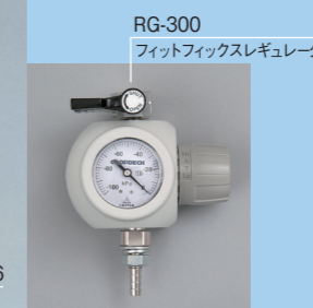
RG-300 フィットフィックスレギュレータ