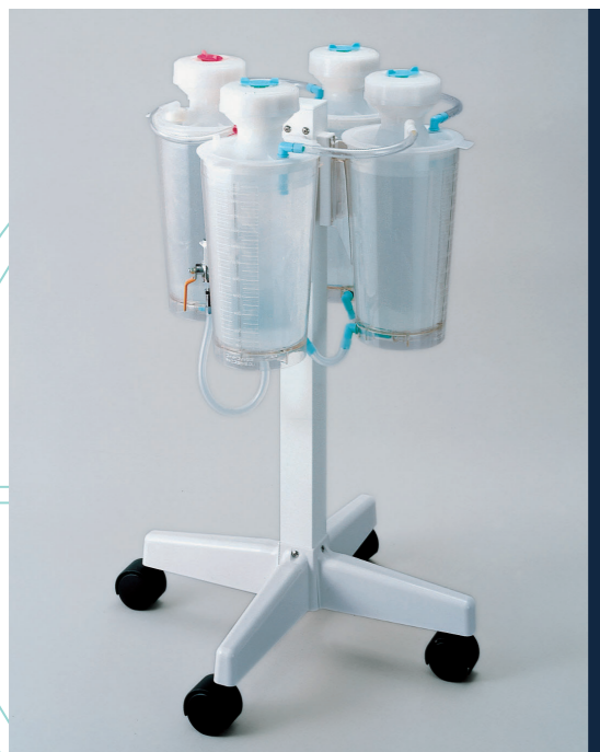
スタンダードタイプ